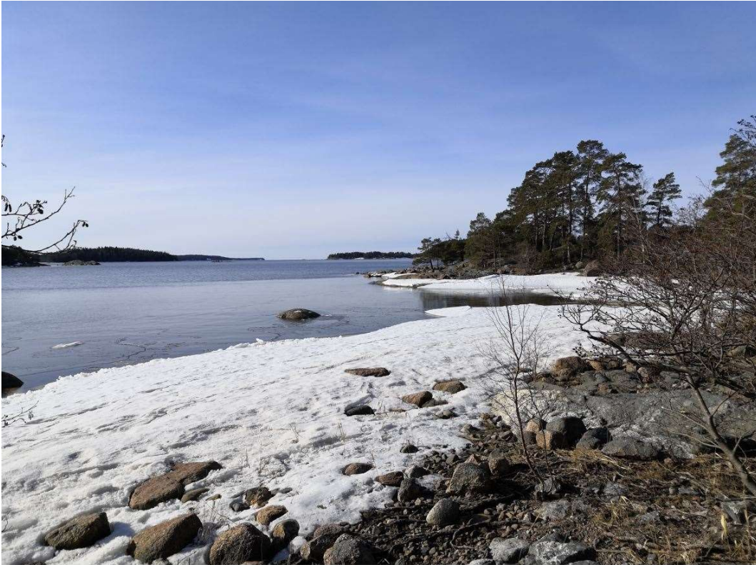
Reitin eteläosassa meri on jo auki ja maasto pääosin sulaa.